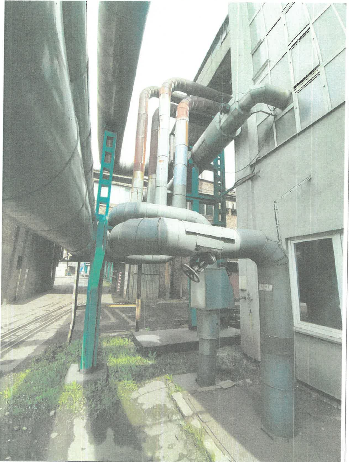
Zdjęcie nr 7

Wędkoks Energia NSE sp. z o.o. Kierownik Biura Nadzoru Eksploatacji